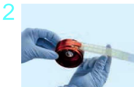
Вставьте агаровую полоску NYCON® в ротор