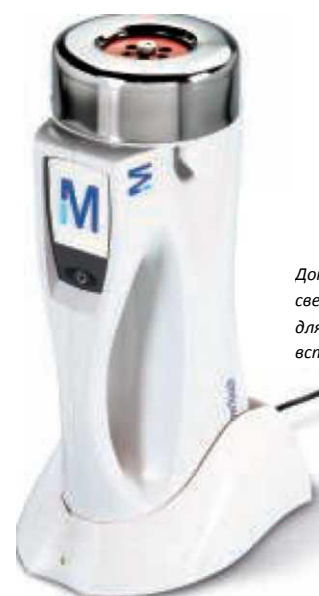
Док-станция со светодиодной индикацией для простой зарядки встроенного аккумулятора