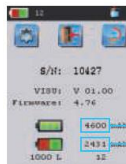
Окно системной информации, показывающее емкость аккумулятора

Заряд аккумулятора Остаток циклов при заданном объеме