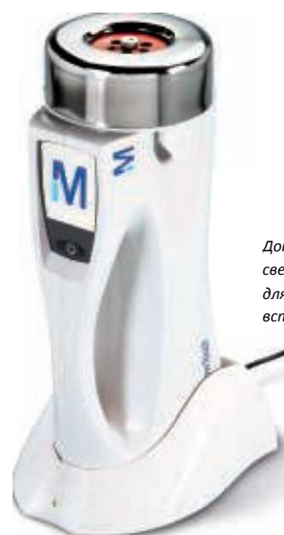
Док-станция со светодиодной индикацией для простой зарядки встроенного аккумулятора