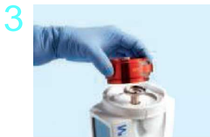
Поместите ротор на прибор