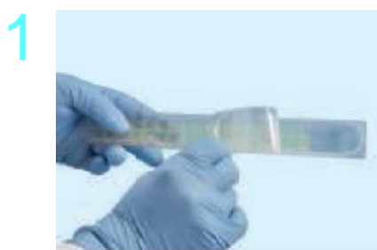
Снимите обертку агаровой полоски NYCON®

Микробиологический пробоотборник воздуха RCS® High Flow Touch используется со стандартизированными агаровыми средами. Такие полоски производятся в строго контролируемых асептических условиях. В результате микробиологический пробоотборник воздуха RCS® High Flow Touch представляет собой полную систему, тщательно проверенную на соответствие стандарту ISO 14698-1.