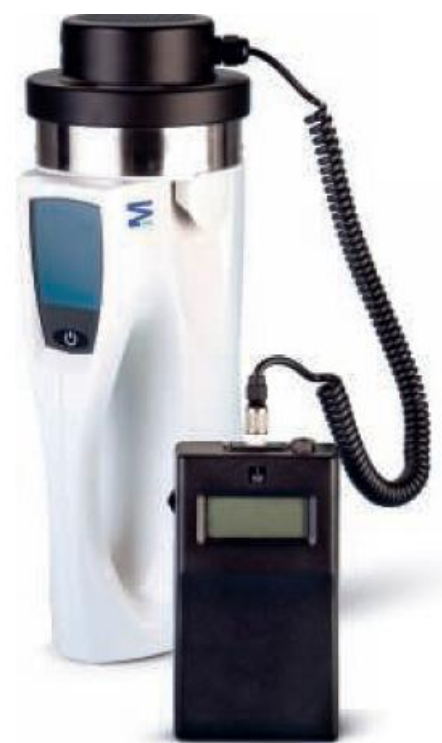
Микробиологический пробоотборник Воздуха RCS® High Flow Touch с анемометром HYCON®