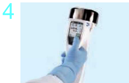
Закройте колпачок – система готова к работе